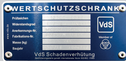
Marke der Zertifizierungsstelle VdS